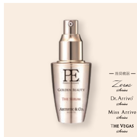
PE コールドンデンチュレーター ザ セラム 40mL 15,400円(税込) 120mL 39,600円(税込)