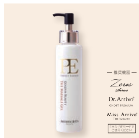
PE コールドンデンチュレーター ザ マッサージジェル 200g 5,500円(税込) 500g 11,000円(税込)