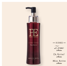
PE コールドンデンチュレーター ザ ボディ 200g 16,500円(税込)