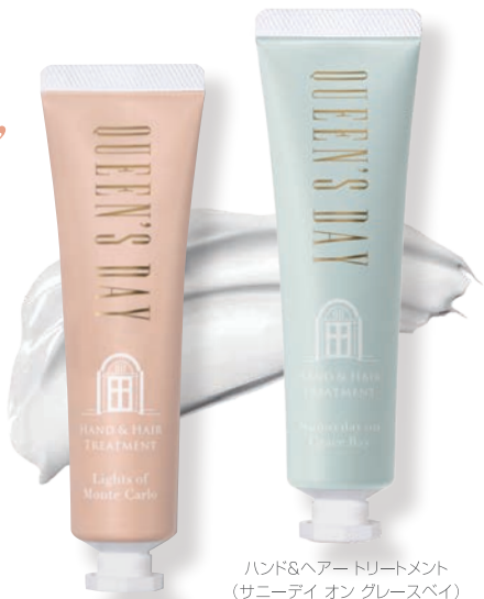
ハンド&ヘアートリートメント (ライツ オブ モンテカルロ)

コクのあるリッチな純白クリームが、肌に溶け込むようになじみ贅沢な香りが心にまで寄り添い癒します。