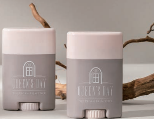
ヴィーガンバームスティック

不要な添加物を排除し、食品と同じ基準をクリア そして、未来の環境や肌への影響を配慮した原料を積極的に採用。