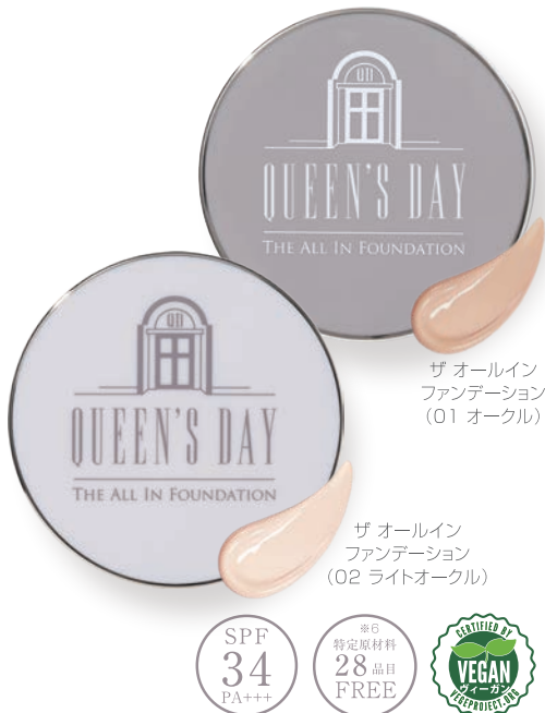
ザ オールインファンデーション (01 オークル)